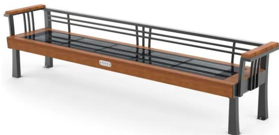
Zdjęcia poglądowe ławki z miejscem dla osób niepełnosprawnych