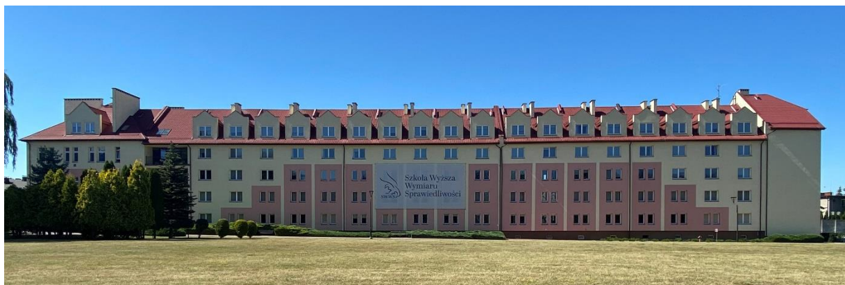
Fotografia 1. Budynek nr 23 (DS-1)