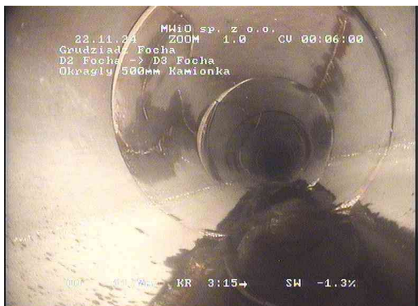
4cdfb1c4-2529-45b9-9bed-b11a05ff7173_20241122_004711_827.jpg, 00:05:47, 12.25 Szczelina, pęknięcie złożone, 2mm szeroki od 8 godz. do 11