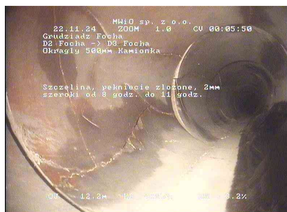
9349d85d-608f-4d76-8dcf-3709991b23b6_20241122_004701_918.jpg, 00:05:47, 12.25 Szczelina, pęknięcie złożone, 2mm szeroki od 8 godz. do 11