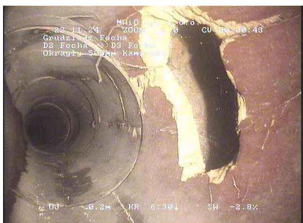
2e65d589-e895-48b8-b030-3ed8ea558be3_20241122_004015_334.jpg, 00:00:26, 0.44 Inne przeszkody, zewnętrzne przewody lub kable