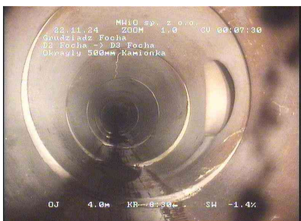
d1268f94-ffc3-4e12-8e6d-c2cda97651b4_20241122_004851_138.jpg, 00:06:59, 5.11 Połączenie, łącznik, przyłącze otwarte, 200mm wysoki przy 2