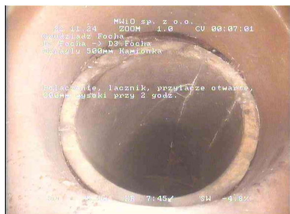
90c3d9ac-77cd-49e9-a293-d35a8cbaa105_20241122_004822_380.jpg, 00:06:59, 5.11 Połączenie, łącznik, przyłącze otwarte, 200mm wysoki przy 2