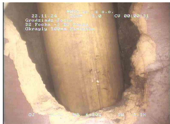
f21faa95-455a-4a00-8070-5b49bab74a5e_20241122_004003_717.jpg, 00:00:26, 0.44 Inne przeszkody, zewnętrzne przewody lub kable