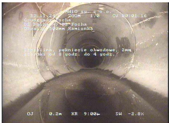
119e7b32-36d2-4d23-9f15-bfc59aefc30c_20241122_004118_422.jpg, 00:01:13, 0.25 Szczelina, pęknięcie obwodowe, 2mm szeroki od 8 godz. do 4