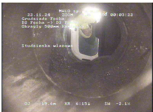
0bd293a3-36e9-49f3-aa46-ca8a3c07a5ce_20241122_004330_528.jpg, 00:03:18, 19.60 Studzienka włazowa