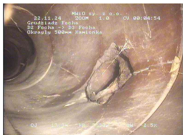
ebebcd3b-4ecc-4928-89c4-d18663a84434_20241122_004516_222.jpg, 00:04:39, 17.93 Połączenie, proste połączenie - wydłutowane, otwarte,