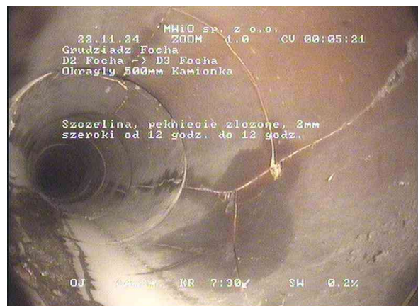
2f0fcdd3-8eac-4f22-af3f-84d6fe576d8f_20241122_004602_306.jpg, 00:05:19, 14.28 Szczelina, pęknięcie złożone, 2mm szeroki od 12 godz. do 12