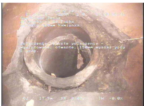
0f5168f2-c335-45ac-8b5c-778c25bfe1ff_20241122_004503_446.jpg, 00:04:39, 17.93 Połączenie, proste połączenie - wydłutowane, otwarte, 150mm wysoki przy 2 godz.