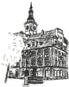
Rynek Wieża ratuszowa

Zamawiający udostępni zestawienie stolarki okiennej i drzwiowej.