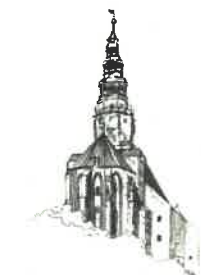
Kościół pw. Św. Stanisława i Św. Wacława Katedra Diecezji Świdnickiej

Dotyczy: postępowania nr P-49/IV/25 o udzielenie zamówienia publicznego obejmującego zadanie inwestycyjne pn.: „Termomodernizacja dwóch budynków użyteczności publicznej Gminy Miasto Świdnica: Urzędu Miejskiego oraz Urzędu Stanu Cywilnego zlokalizowanych przy ul. Armii Krajowej 47-49”