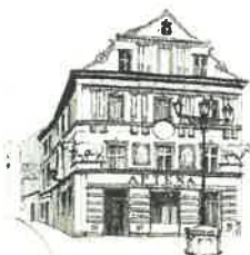
Kamienica „Pod Bykami”