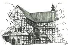
Kościół Pokoju pw. Św. Trójcy Wpisany na listę UNESCO

Dotyczy: postępowania nr P-49/IV/25 o udzielenie zamówienia publicznego obejmującego zadanie inwestycyjne pn.: „Termomodernizacja dwóch budynków użyteczności publicznej Gminy Miasto Świdnica: Urzędu Miejskiego oraz Urzędu Stanu Cywilnego zlokalizowanych przy ul. Armii Krajowej 47-49”