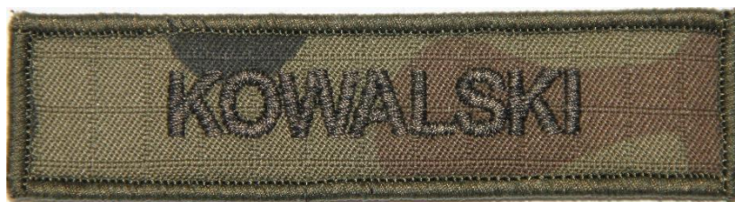
Rysunek 1 – Oznaka identyfikacyjna z nazwiskiem do ubioru polowego Wzór 133A/MON

Wymiary zgodnie z Rozporządzeniem Ministra Obrony Narodowej z dnia 19stycznia 2024 r w sprawie zasad noszenia umundurowania przez żołnierzy (Dz.U. poz. 64): szer. 100 mm, wys. 25 mm, wysokość liter 8,8 mm.