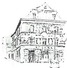
Kamienica „Pod Bykanim”