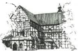
Kościół Pokoju pw. Św. Trójcy Wpisany na listę UNESCO