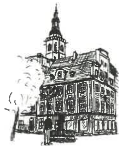
Rynek Wieża ratuszowa