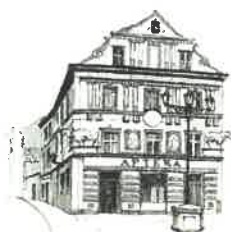
Kamienica „Pod Bykami”