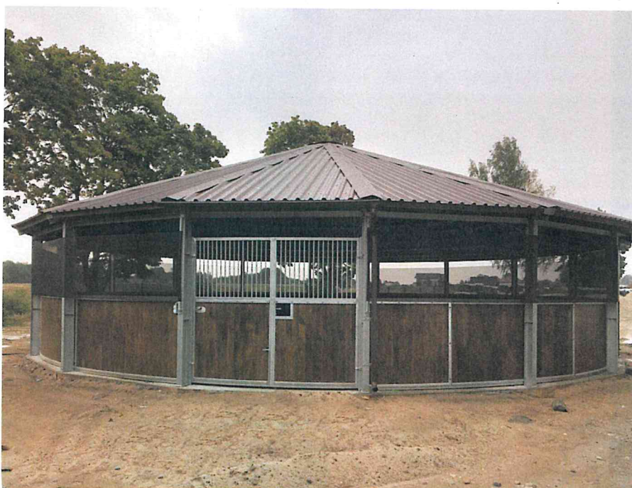
Kryty lonżownik, przykład.