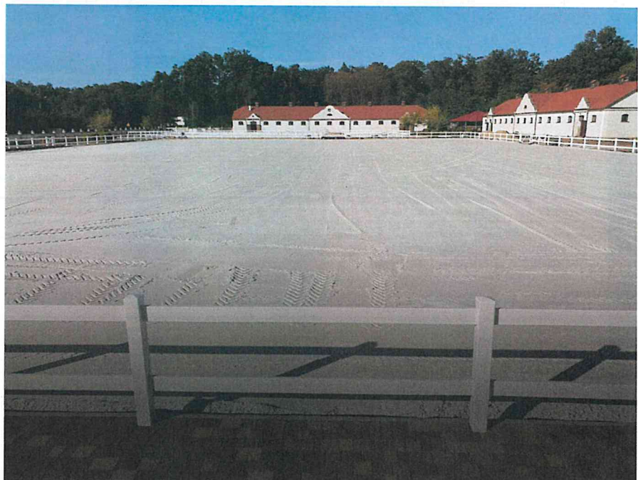
Ujeżdżalnia zewnętrzna z nawierzchnią z piasku kwarcowego, przykład.